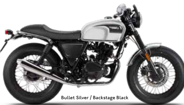
Bullet Silver / Backstage Black

PNEU AVANT / PNEU ARRIERE 100/90-18 / 150/70-17 FREIN AVANT Etrier de frein hydraulique 2 pistons Double disque: Ø 310 mm (ABS) FREIN ARRIERE Etrier de frein hydraulique 2 pistons Disque: Ø 260 mm (ABS) VOLUME DU RESERVOIR 16,0 l CONSUMMATION* 4,6 l / 100 km ÉMISSIONS DE CO 2 * 105 g/km COULEURS**