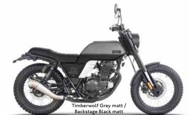
Timberwolf Grey matt / Backstage Black matt