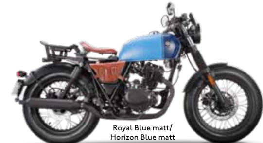
Royal Blue matt / Horizon Blue matt