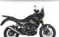
Backstage Black matt