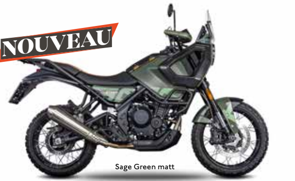
Sage Green matt