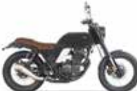
Backstage Black matt