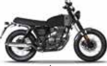
Titan Black / Sterling Grey