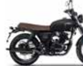
Backstage Black / Titan Black