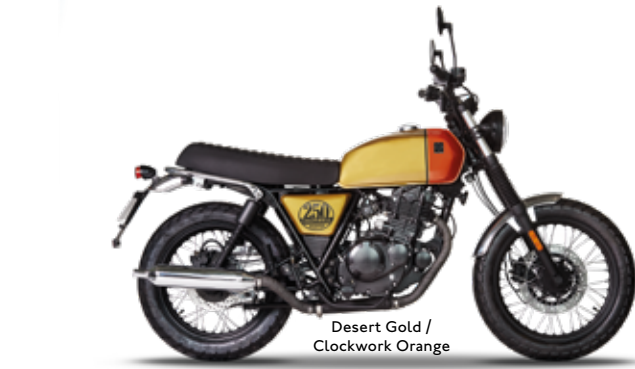
Desert Gold / Clockwork Orange