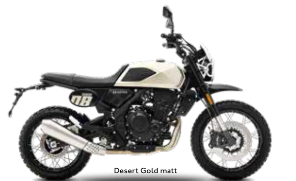
Desert Gold matt