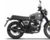
Timberwolf Grey matt