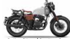
Bullet Silver / Sterling Grey