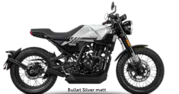
Bullet Silver matt

PNEU AVANT / PNEU ARRIERE 120/70-18 / 140/70-17 FREIN AVANT Etrier de frein hydraulique 4 pistons, disque de frein unique Ø 300 mm FREIN ARRIERE Etrier de frein hydraulique 1 piston, disque de frein unique Ø 218 mm VOLUME DU RESERVOIR 11,0 l CONSUMMATION* 2,6 l / 100 km ÉMISSIONS DE CO 2 * 59 g/km COULEURS**