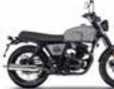
Timberwolf Grey glossy