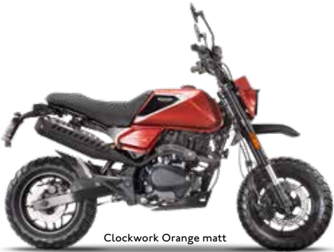
Clockwork Orange matt