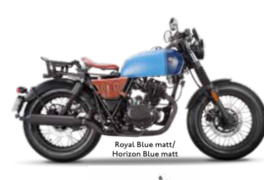
Royal Blue matt / Horizon Blue matt