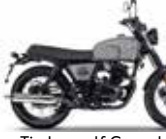
Timberwolf Grey glossy