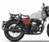
Bullet Silver / Sterling Grey