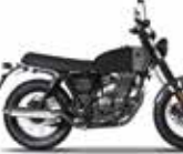
Titan Black / Sterling Grey