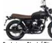
Backstage Black / Titan Black