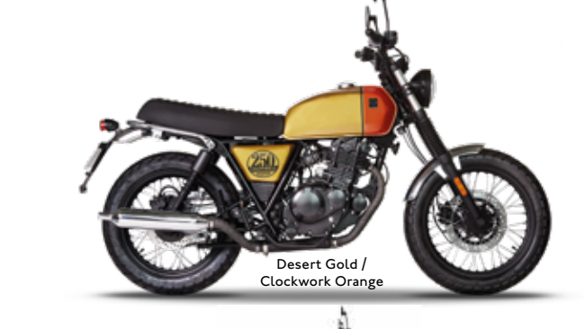
Desert Gold / Clockwork Orange