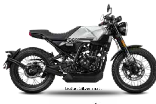
Bullet Silver matt