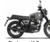
Timberwolf Grey matt