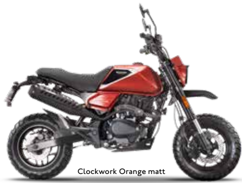
Clockwork Orange matt